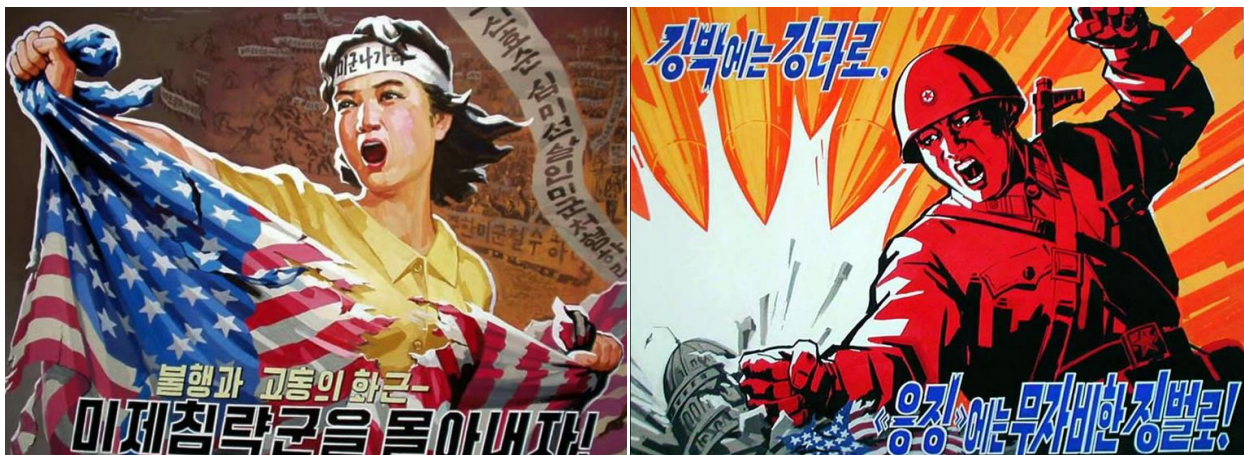
Imagen 2 y 3: Emol Fotos