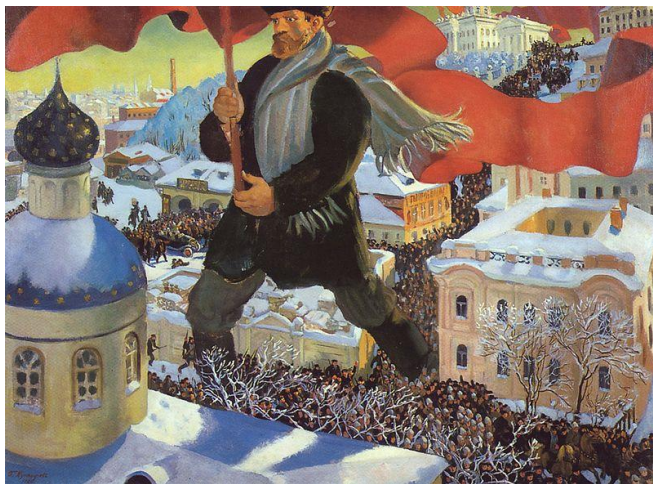
Imagen 1: Borís Kustódiev: Bolchevique, 1920, óleo sobre lienzo, Galería Tretiakov, Moscú, Rusia.

(imagen 1) del artista Borís Kustódiev en la cual se empieza a observar estos rasgos, una representación con una jerarquización de una figura central en acción, en este caso, sosteniendo la bandera partidaria. Encontramos similitudes en las propagandas que se exponen a continuación (imagen 2 y 3) en las cuales se observa la centralidad de los norcoreanos magnifican la representación de su figura ya sea de una persona o un armamento bélico y de manera inferior la representación de soldados o de los Estados Unidos. Según Salazar García, se debe a la perspectiva jerárquica en la que se destaca su superioridad frente a sus enemigos.