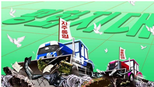
Imagen 9: BBC

Un año más tarde de dichas sanciones (2018), se observa cambios en las formas de propagandas, no fueron rojas y bélicas, sino que el color preponderante era el verde e intentaban graficar más tranquilidad. Estas propagandas se enmarcan en el desarrollo de la Cumbre intercoreana de 2018 para mejorar las relaciones entre ambas coreas y reducir la nuclearización bélicos, Corea del Norte acompañó con las graficas estas cuestiones.