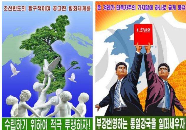
Imagen 10: EL MUNDO