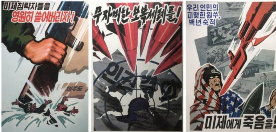
Imagen 6: BBC

A medida que pasan las décadas la intensidad bélica en las propagandas fue disminuyendo, cuando ocurre alguna situación que Corea del Norte se siente atacada, vuelven a aparecer propagandas de este estilo, como sucedió en el 2017 cuando las Naciones Unidas sancionaron a Corea del Norte por su programa nuclear, expusieron mensajes claros para el exterior, si nos atacan, tenemos la fuerza para responder, este mensaje que se sostiene desde la Guerra expone la inestabilidad y tensión no solo en la península, sino también a nivel internacional. Según el medio Infobae “Una de las ilustraciones divulgadas el jueves por la Agencia Central de Noticias (KCNA) de Pyongyang muestra imágenes de una serie de misiles explotando en Washington D.C. La frase " Nuestra respuesta " en coreano”.