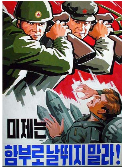
Imagen 4 y 5: Emol fotos

(4) En la leyenda de este póster se lee: "A expulsar a los estadounidenses y a unificar la Tierra Madre".