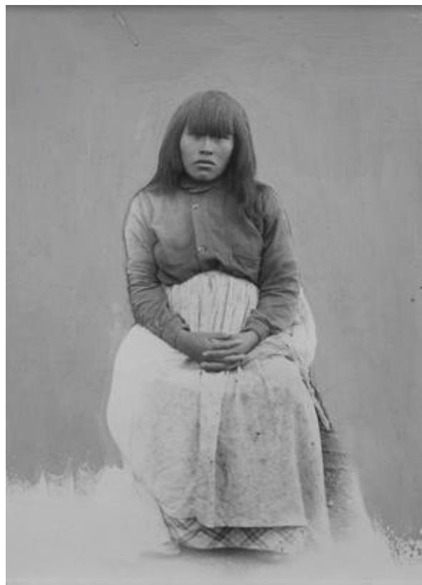
Fig. 3 - Roberto Lehmann-Nitsche, Viaje a Tierra del Fuego, 1902. Ibero-Amerikanisches Institut N-0070 s66.