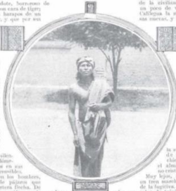
Bajo el calor de un día de verano, entraba a Jujuy para cambiar diez.

el pueblo gusta querer a indios, y yo repolar mucho vino.