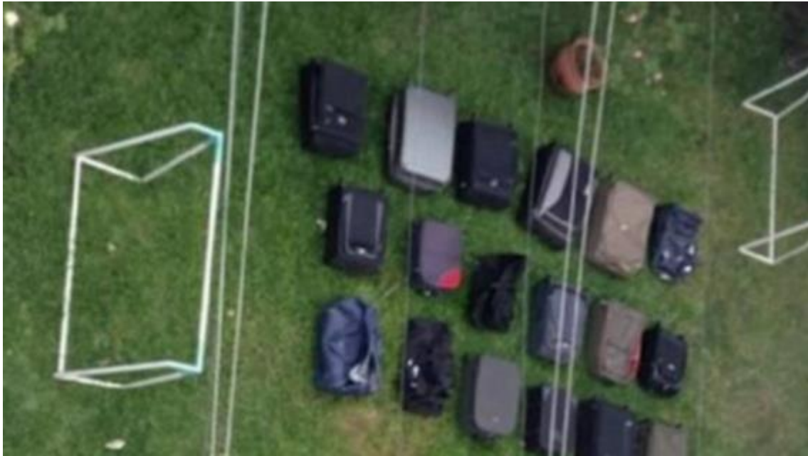
Fig. 6 - Diario Clarín , "Las valijas que encontraron en la casa de Milagro Sala", 30 de abril de 2016.