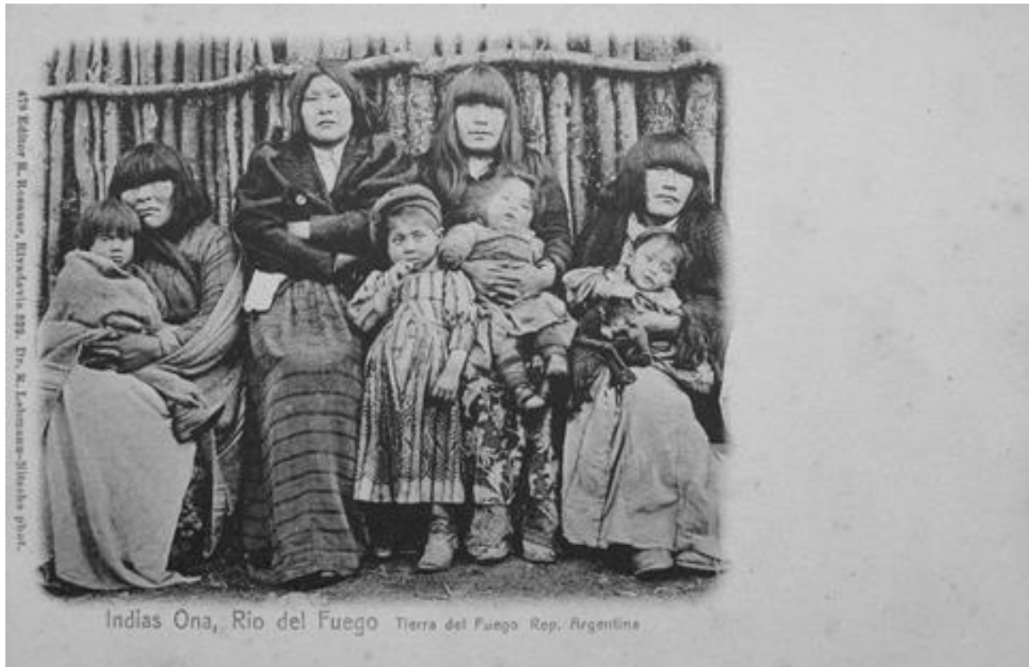
Fig. 2 - Indias Ona, Río del Fuego Tierra del Fuego Rep. Argentina 479 Editor R. Rosauer, Dr. R. Lehmann-Nitsche phot.