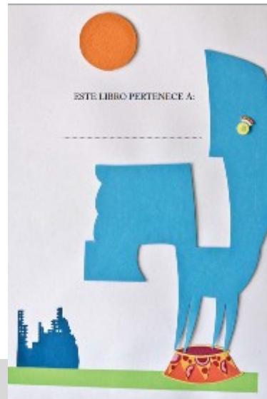
Diseño del espacio destinado para que cada niño escriba su nombre En la Primera entrega y en la Segunda

Dentro de la regularidad en el formato y diseño que ofrece la colección, algunos ilustradores de la segunda entrega proponen imágenes más audaces tanto desde su dimensión metafórica como desde las técnicas de realización.