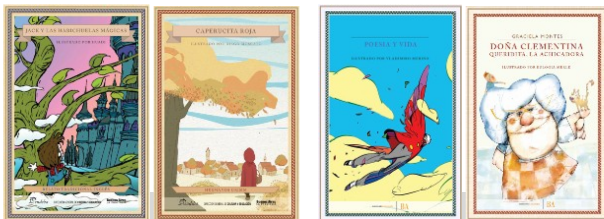
Diseño de tapa de la Primera entrega

Si bien todo el corpus sostiene una unidad desde el diseño y el concepto editorial, cada entrega presenta sus particularidades. Así, los libros de la Segunda entrega incluyen, a diferencia de la Primera, una guarda u hoja de respeto; un prólogo (en todos los casos escrito por Mempo Giardinelli); el espacio destinado para la escritura del nombre del alumno está jerarquizado desde el diseño, otorgándole una página entera; y tapa delantera y trasera tienen un diseño más estilizado, austero, con el nuevo logo institucional de la provincia.