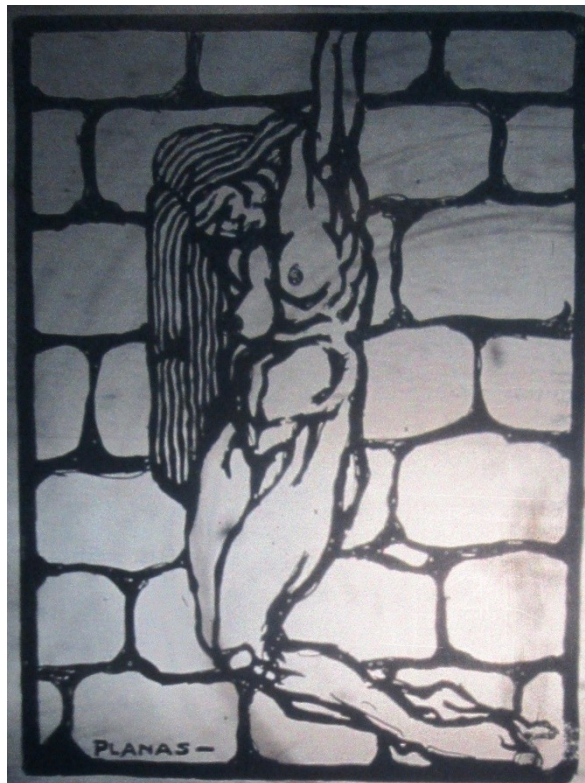
Imagen 5: Ilustración de Planas para un artículo titulado “La Prostitución”

La manifestación artística, de esta manera es una de las cuestiones fundamentales en Revista de Oriente , ya sea para elevar culturalmente a los obreros como para expandir su número de lectores. Esta característica coincide con el proyecto que se llevaba adelante en Rusia luego de la Revolución Bolchevique. Es decir, la creación de museos, muestras y apoyo a los artistas del país y el acceso de esto a los trabajadores para instruirlos y mejorar su espectro cultural. A partir de esto, es posible afirmar que a pesar de que la estética no imita las vanguardias rusas, el objetivo del uso del arte y la cultura como medio para llegar a los trabajadores es tomado por este proyecto editorial para alcanzar la difusión de sus propuestas políticas y sociales.