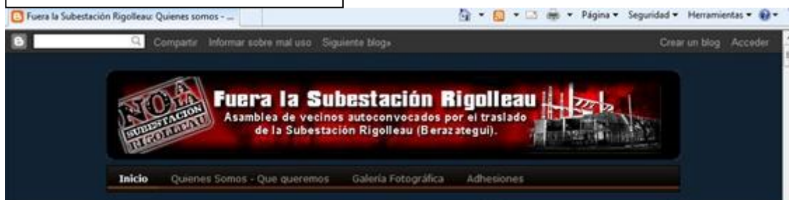
Imagen 1: Encabezado del Blog

En el blog incluyen un encabezado sobre un lúgubre fondo negro y con manchas rojas las leyendas “ No a la Subestación Rigolleau ” “ Fuera la Subestación Rigolleau, Asamblea de vecinos autoconvocados por el traslado de la Subestación Rigolleau (Berazategui) ”. El texto en blanco y negro, que matiza con los colores de fondo, ocupa dos tercios del encabezado anclando fuertemente en la pequeña imagen de la subestación ubicada hacia el límite derecho del blog, a tal punto que da la impresión que fuera a salirse de foco. Una estrategia interesante