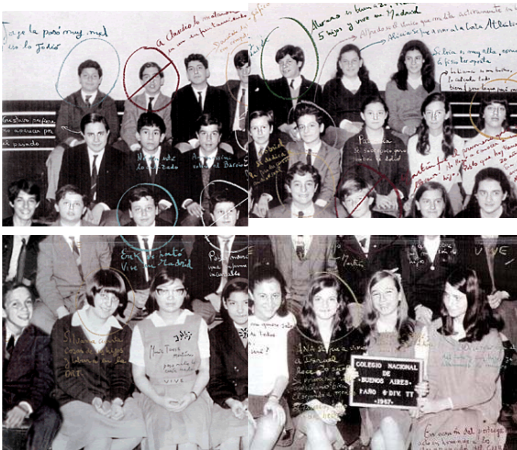
Foto 5: de la serie “Buena Memoria”, “1er Año 6ta División 1967” de Marcelo Brodsky