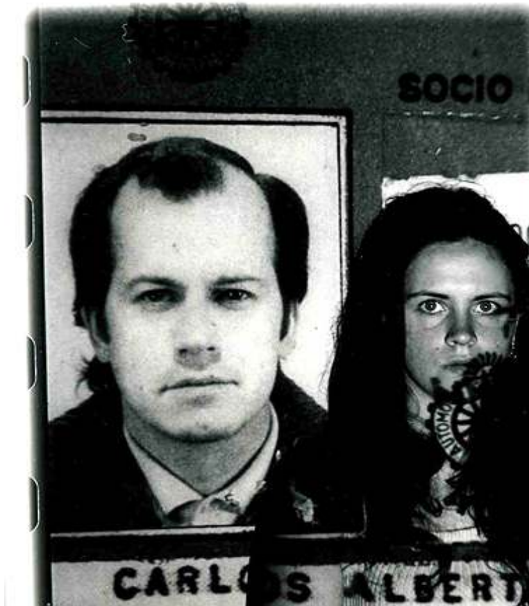
Foto 7: De la serie “Arqueología de la Ausencia” de Lucila Quieto