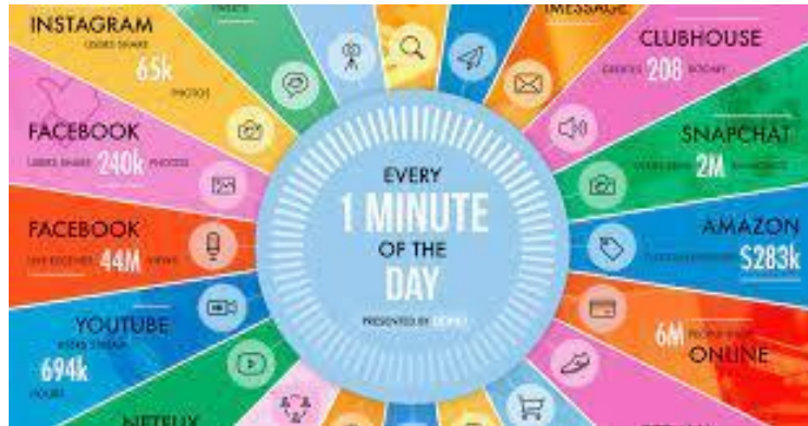
Figura N° 2: "Un minuto en Internet" en "Infographic Data Never Sleeps 8.0"

En el corazón de la actividad digital del mundo se encuentran los servicios y aplicaciones cotidianos que se han convertido en elementos básicos de nuestras vidas. En conjunto, estos producen cantidades inimaginables de actividad del usuario y datos asociados.