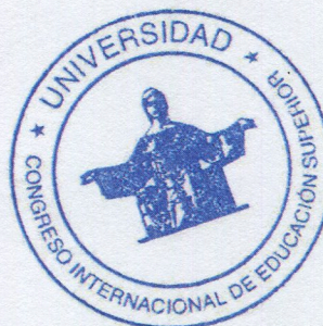
Coordinador del Taller