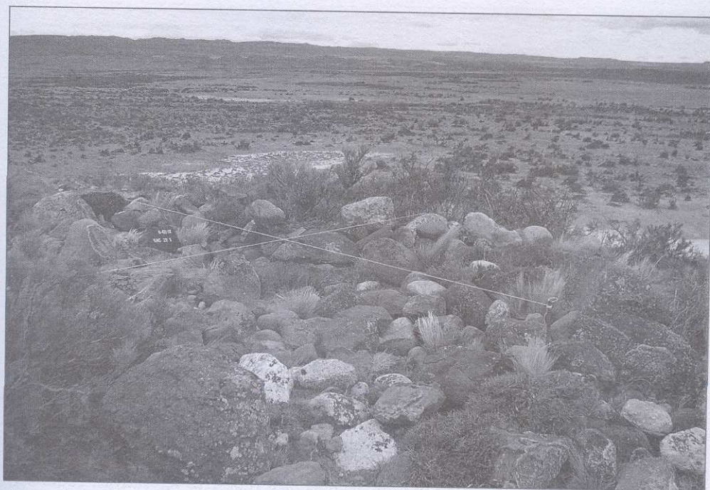
Figura 2. Chenque del lago Salitroso.

En él se incluyen los lagos Belgrano, Nansen, Azara, Volcán, Mogote y Burmeister. El clima es templado-frío y las precipitaciones se ubican entre 200 y 400 mm anuales. A causa de las diferencias altitudinales y longitudinales, dentro del área del Parque se incluyen distintos ambientes, principalmente el bosque andino de Nothofagus y la estepa herbácea-arbustiva.