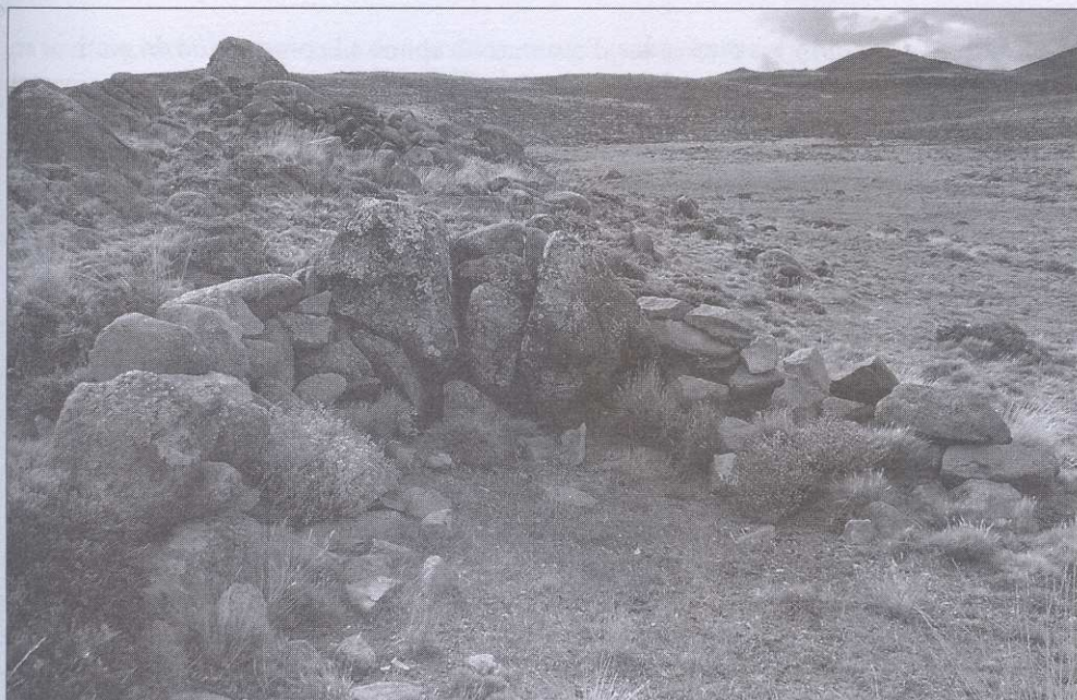
Figura 3. Parapetos de Cerro Pampa.

habrían sido caracterizadas principalmente por campamentos residenciales donde se realizaban muchas de las actividades cotidianas.