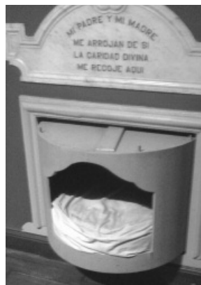
Imagen 1. Torno utilizado en el Asilo de Expósitos y Huérfanos sin identificar la fecha. Museo Histórico Nacional. Casa de Rivera.

El tercer objetivo, y no menos importante, es la conceptualización histórica de algunos términos utilizados en los documentos y necesarios para entender, entre otras cosas, preconceptos sociales hoy día naturalizados; las necesidades y expectativas de los padres que buscaban adoptar niños, y los objetivos y proyectos perseguidos por el primer orfanato montevideano.