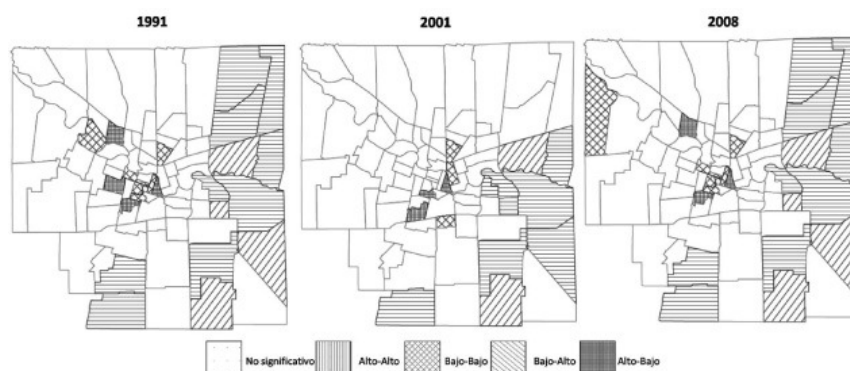
Figura 3 Indicadores LISA. Ciudad de Córdoba. Abandono escolar en niños entre 13 y 14 años. Años 1991, 2001 y 2008