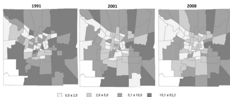
Figura 1. Ciudad de Córdoba. Porcentaje de niños entre 13 y 14 años que han abandonado los estudios, según fracción censal. Años 1991, 2001 y 2008

Fuente: Elaboración propia con base en los Censos de Población de 1991, 2001 y 2008.