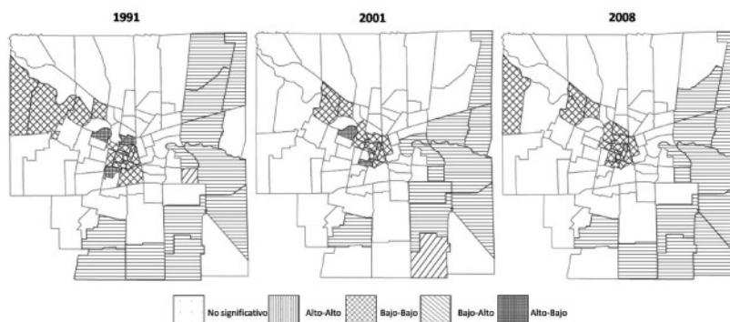
Figura 4 Indicadores LISA. Ciudad de Córdoba. Abandono escolar en niños entre 15 y 17 años. Años 1991, 2001 y 2008