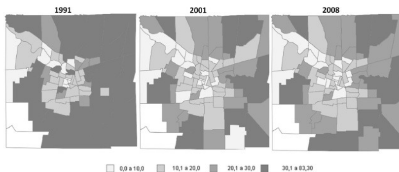
Figura 2. Ciudad de Córdoba. Porcentaje de niños entre 15 y 17 años que han abandonado los estudios, según fracción censal. Años 1991, 2001 y 2008