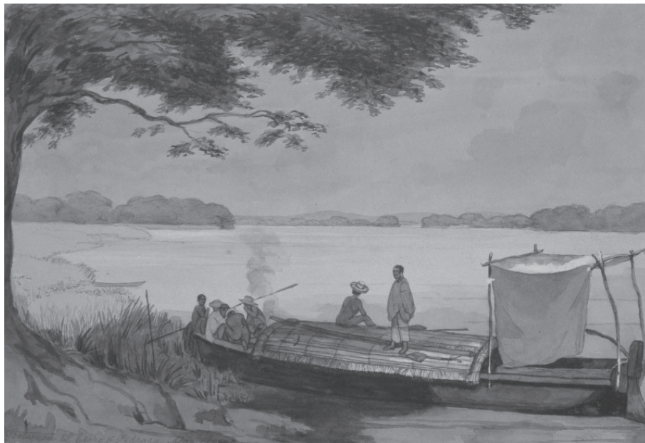
Edward Walhouse Mark, Bongo del Magdalena . 1845. Acuarela sobre papel, 17,3 x 25 cm (Reg. 0100). Colección Banco de la República

La “voluntad” para laborar en la minería dependía más de su amo o mayordomo , pero “desde que éste