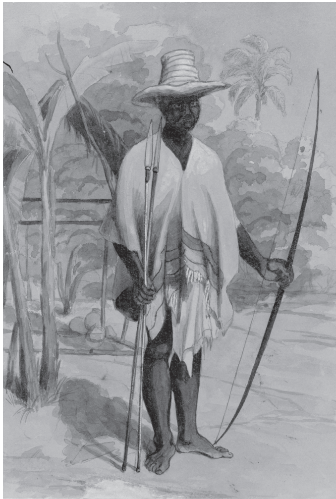
Edward Walhouse Mark, Tipo de negro del Magdalena . 1845. Acuarela sobre papel, 25,1 x 17,4 cm (Reg. 0064). Colección Banco de la República

El contraste entre las diferentes constituciones de las razas no puede ser más explícito: lo que para unas significan condiciones en las cuales se aumenta su número gozando de buena salud, “fuertes y robustos”, para otras significan la pérdida de su vida, o cuando menos, su súbita abreviación sumidos en la irremediable debilidad y enfermedad: “Ni los de raza blanca ni sus descendientes (unos i otros acostumbrados a los ardores del sol en otros climas) pueden sin embargo venir a estas tierras riquísimas en oro i terrenos cultivables, sino bajo pena irremisible de la vida” (Pérez, 1862: 293). La raza africana y sus mezclas y los indios de un lado, la raza blanca y sus descendientes del otro, en un espectro derivado del clima de los países de las llanuras con ríos auríferos.