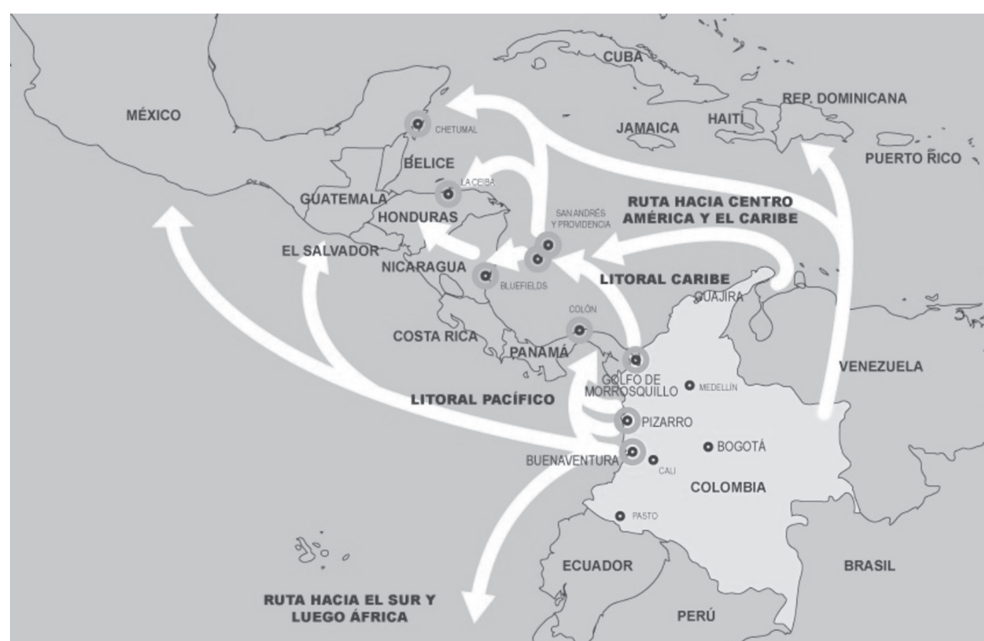
Mapa 1. Ubicación del archipiélago de San Andrés, Providencia y Santa Catalina, rutas vector Caribe occidental y Pacífico

Fuente: elaborado a partir de información de la Dirección Operaciones Navales, Armada Nacional de Colombia, 2013.