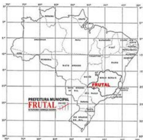
Figura 3 - Localização do município de Frutal

Segundo dados do IBGE (2010), Frutal conta com uma população de 53.474 habitantes, sendo 27.074 homens e 26.400 mulheres.