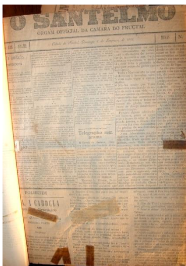
Reprodução: jornal “O Santelmo” Fonte: (reprodução família Plastino)

O apoio à democracia sempre foi uma preocupação visível a cada edição, por este motivo, “O Santelmo” se transformou em um órgão reconhecido e prestigiado em todo território do Triângulo Mineiro.