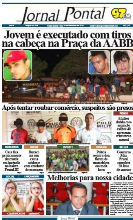
Figura 1 – Primeira página do Jornal Pontal de 24 de setembro 2015

Na maioria das amostras (nove de dez), 6 (seis) páginas eram coloridas e 8 (oito) eram em preto e branco.