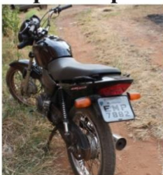
Motocicleta estava com chassi rasgado e placa feita artesanalmente, mas que a mesma estava sem chassi rasgado. Pelo tipo que apresentava esse chassi, a mo-

De acordo com o policial, não foi localizada nenhuma combinação de abandono desta motocicleta e a polícia constata-