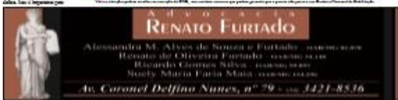
Figura 2 – 7ª página (Caderno A) do Jornal Pontal de 1º de outubro de 2015