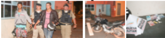
Polícia Militar em operação na Vila Lagoinha em Ilhéus.