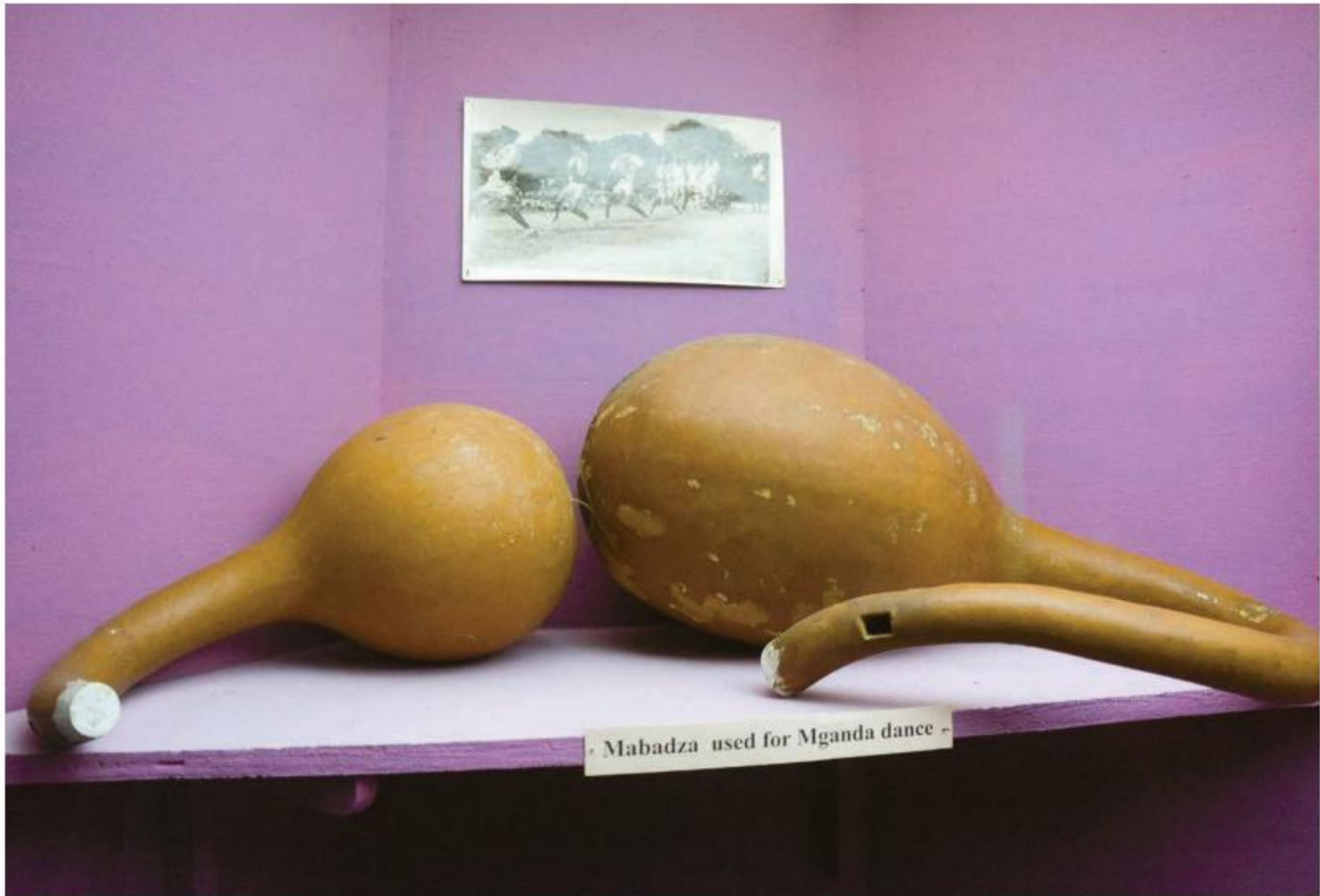
KAZOO. BOCINAS BADZA PARA MGANDA, MALAWI.

distritos de Mangochi, Salima y Dedza (Kalinga, 2012; Malawi SDNP, s/f.); en ella también se visten imitaciones de uniformes militares. En el centro de Malawi (distritos de Kasungu, Nkhota Kota, Salima, Ntchisi, Dowa y Lilongwe) se interpreta un género/danza similar al beni , la mganda (Malawi SDNP, s/f.), la cual es muy popular entre los Chewa, el grupo étnico dominante de ese país (Tembo, 2013), y entre los cercanos Ngoni (Kalinga, 2012). Sobre la mganda de los Chewa, Nthala (2013: 142-157) indica: