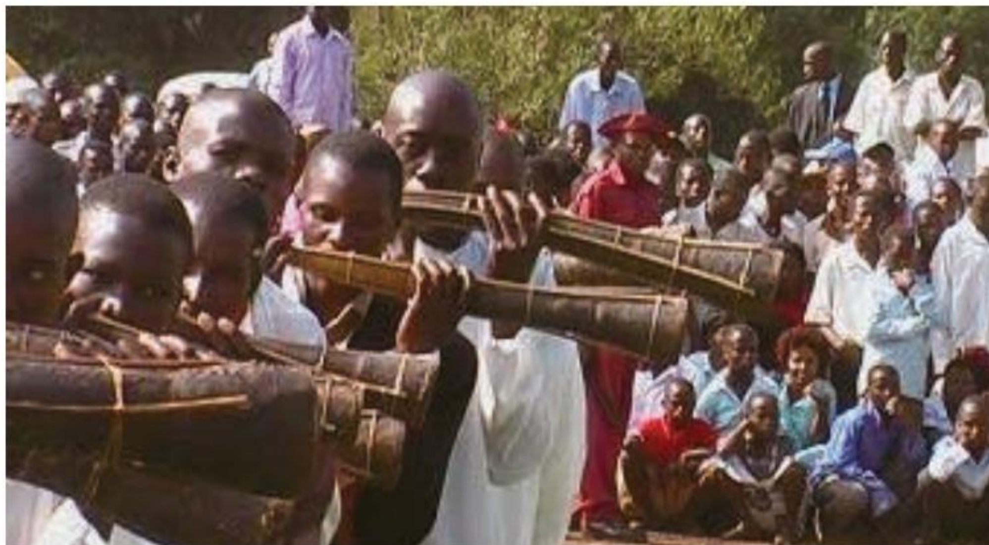
TROMPETAS WAZA DEL PUEBLO BERTA (ETIOPÍA).

Los paralelos más cercanos de esos instrumentos —y, concretamente, de la bocina o amplificador