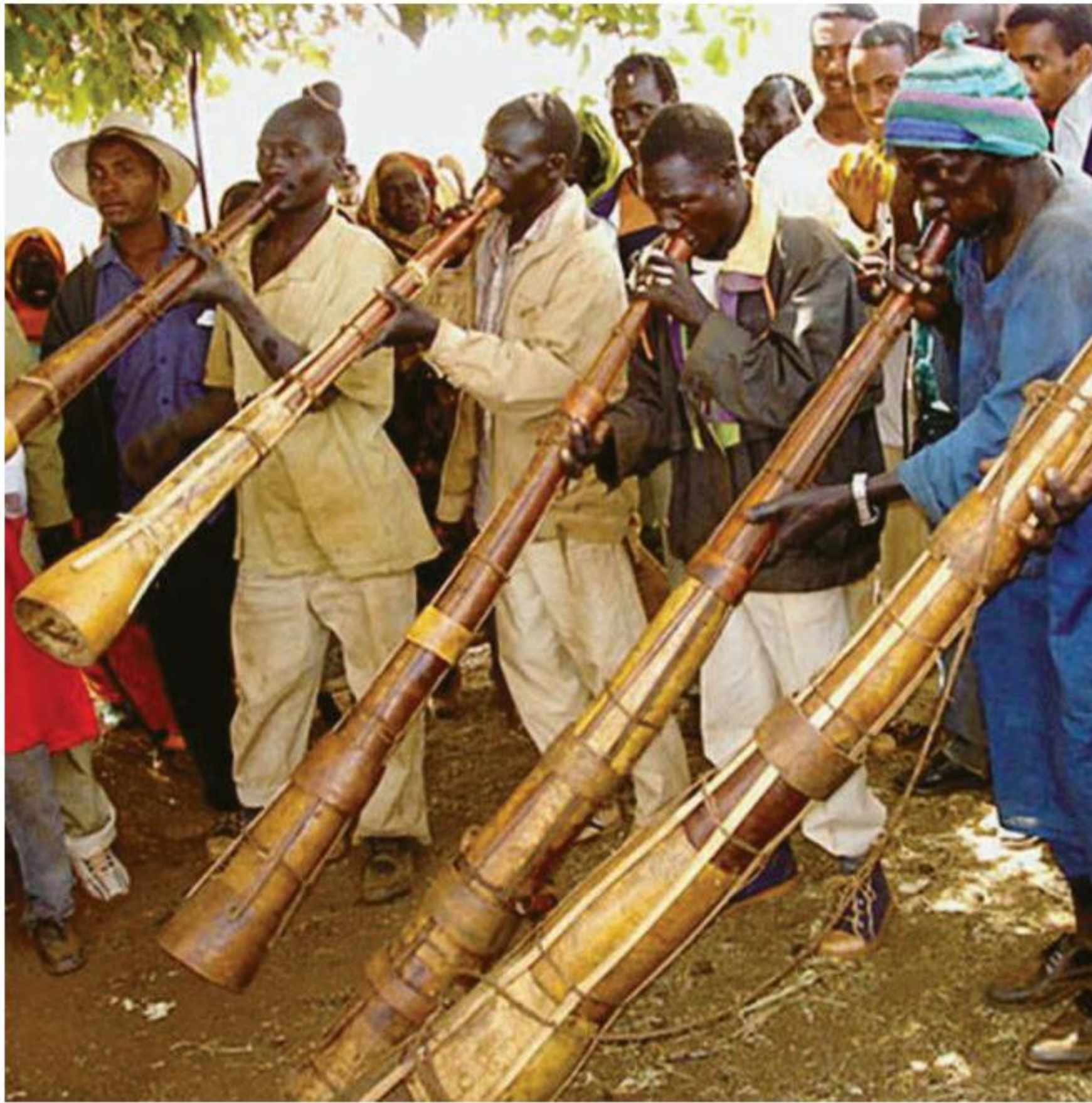
INTÉRPRETES DE AMAKONDERE DE UGANDA.

idiosincracia y a sus posibilidades; un caso claro es el de la música adaha de los Fanti de Ghana, surgida hacia 1880 (Collins, 2004). En el África oriental, esa música, conocida como beni (deformación del inglés band ), se inspiró en las marchas y desfiles del ejército británico durante las postrimerías del siglo XIX. En Zanzíbar y la costa de Kenia, fue imitada por los Swahili musulmanes (que copiaron tanto los pasos de desfile como el sonido de los metales, e incluso la indumentaria y la jerarquía de los integrantes de la banda), y más tarde por los askaris (soldados locales que engrosaban las filas de las tropas coloniales) de la República de Tanganica alemana, la actual Tanzania (Ranger, 1975).