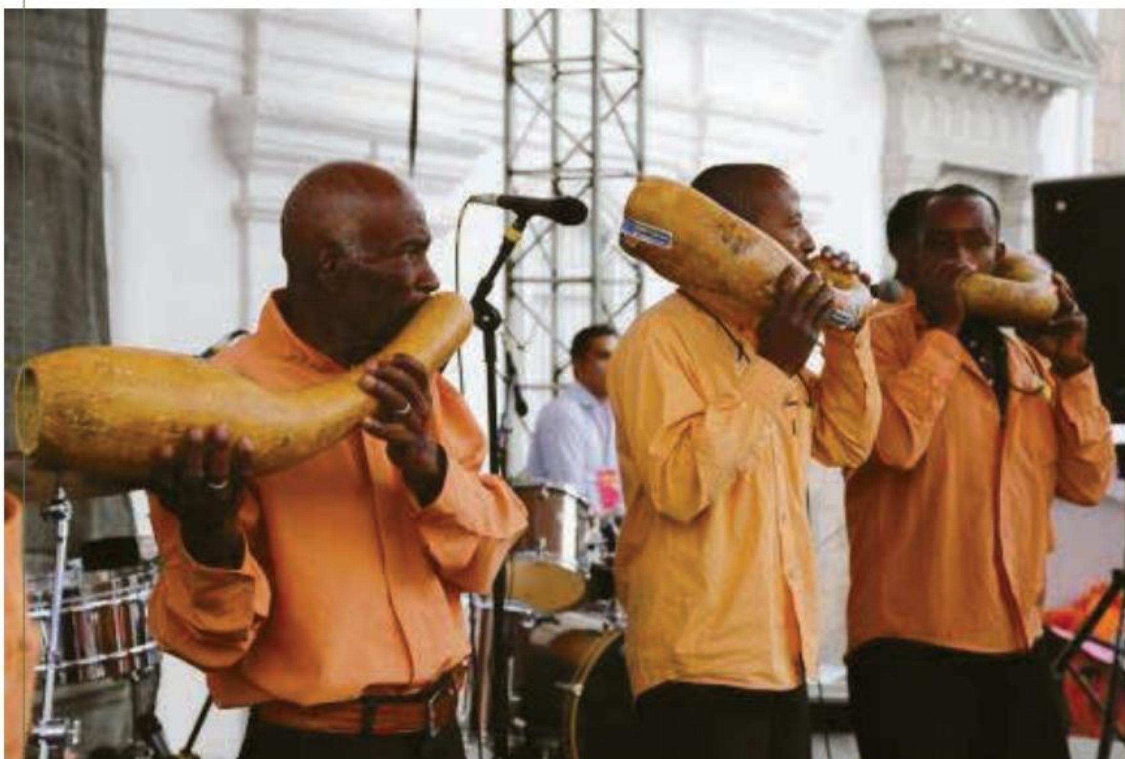
PUROS DE BANDA MOCHA. EL UNIVERSO.COM, 26/07/2015

La banda mocha es un conjunto instrumental tradicional masculino originario de las comunidades del valle del río Chota, curso de agua que marca parte del límite entre las provincias de Imbabura y Carchi. Se trata de una expresión musical típicamente afroecuatoriana, sin ningún paralelo documentado entre grupos indígenas, mestizos o afrodescendientes del resto de América Latina.