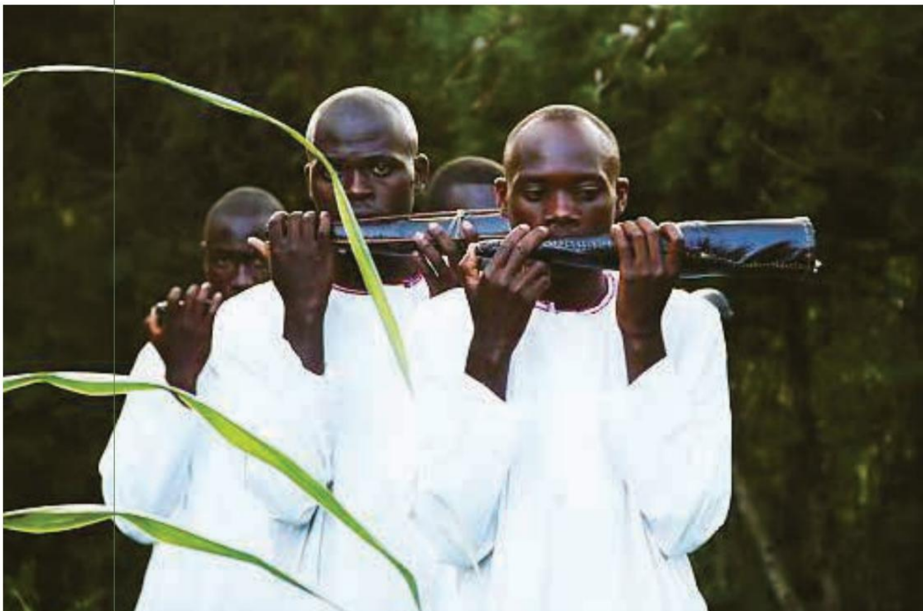
● INTÉRPRETES DE AMAKONDERE DE UGANDA. BRITISH LIBRARY SOUNDS

de calabaza, elemento mayoritario dentro de una banda mocha— se encuentran en África. Allí no solo se usan resonadores de calabaza, sino que en algunas regiones se les da un uso musical similar, si no idéntico, al que reciben en Ecuador.