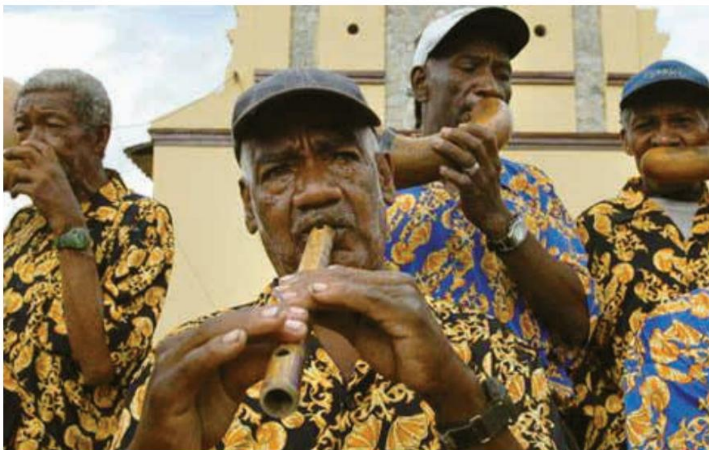
PINKILLO Y PUROS DE BANDA MOCHA. AFROECUADORIANCULTURE.BLOGSPOT.COM

Apareció hacia finales del siglo XIX, cuando músicos del Chota intentaron imitar la formación y el sonido de las típicas bandas de música de origen europeo, generalmente militares, que durante el período republicano amenizaban los eventos festivos en tierras ecuatorianas. Sin recursos para emularlas, se vieron forzados a sustituir los instrumentos de viento de madera y metal por otros hechos con los materiales que tenían más a mano en un entorno predominantemente agrario. El resultado, que ha sobrevivido hasta nuestros días, incluye calabazas ( puros ) de varios tamaños, secas y vaciadas, tallos de agave perforados, cañas y hojas.