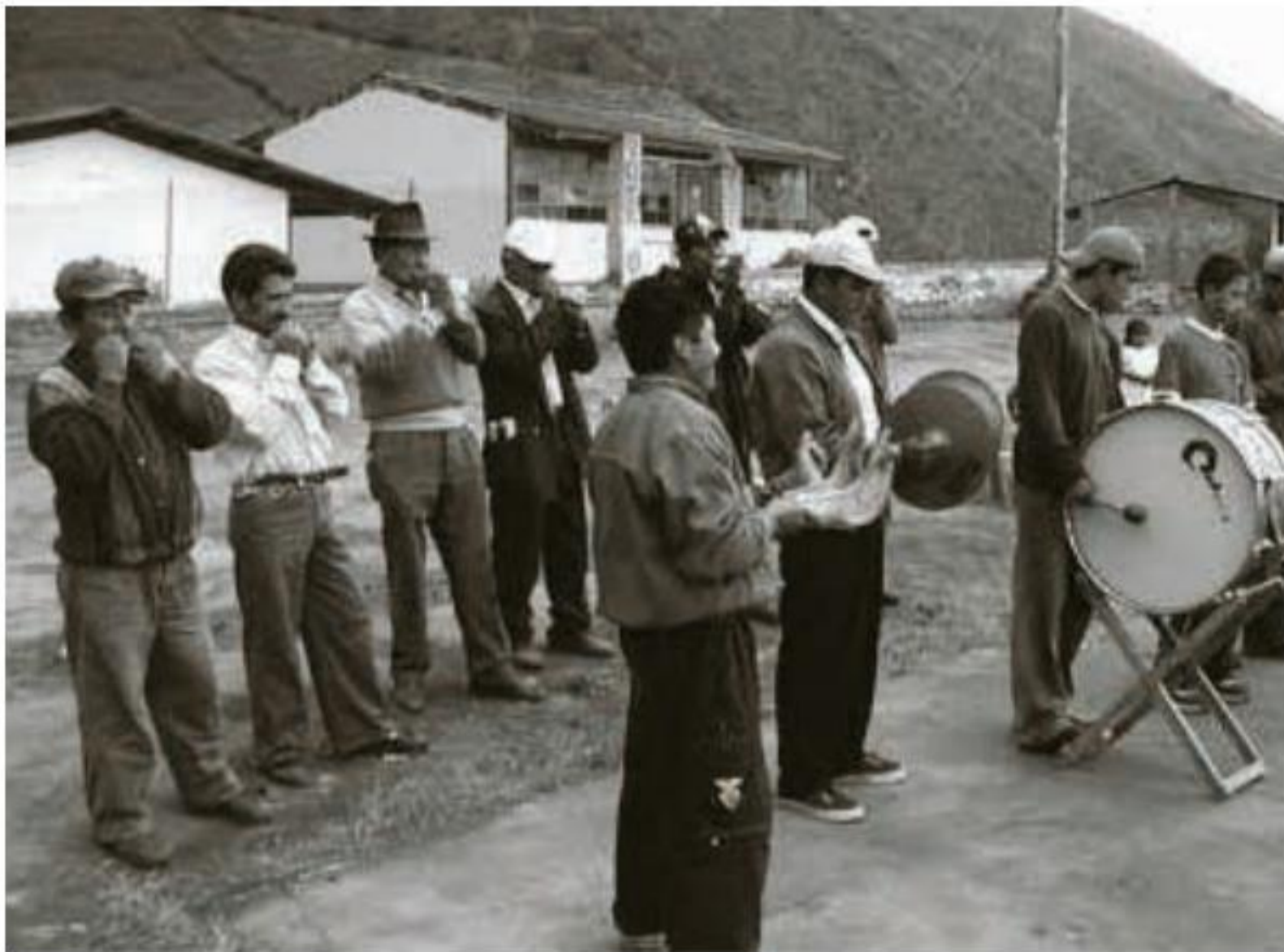
BANDA MOCHA DEL MIRA. MIRA.EC

El aprovechamiento de hojas de distintas plantas como aerófonos libres ha sido documentado en todo el mundo; buena parte de las sociedades indígenas de Ecuador se ha servido de ellas y no es de extrañar, pues, verlas sonando en manos afroecuatorianas.