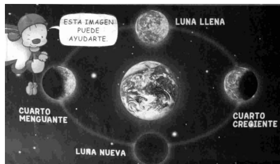
Figura 1: Imagen de libro escolar sobre las fases lunares que posee errores conceptuales y didácticos.

A su vez, dado que los dibujos esquemáticos que se presentan en los textos constituyen construcciones humanas que persiguen una intención específica, es común que muchas imágenes astronómicas presenten errores debido a cualidades particulares que dificultan su interpretación, tales como representar algo que no se ve desde ninguna posición, representar desde una posición de observación lo que se vería desde otra o indicar en una misma imagen lo que se vería desde dos o más posiciones de observación. Como ejemplo de esto, en la Figura 1 se muestra una imagen extraída de un libro escolar que presenta varios errores: a) la parte iluminada de la Luna no "apunta" siempre hacia el Sol, b) la Luna está dibujada en el espacio exterior, pero del modo en que se vería desde la superficie terrestre, c) la lunas en cuarto creciente o menguante no son "cuartos" de Luna y d) no está dibujada ni indicada la posición del Sol.