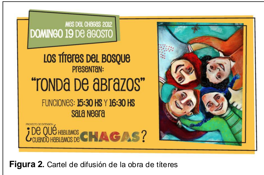
Figura 2. Cartel de difusión de la obra de títeres

grandes y chicos donde desde la poesía y la ternura, los Títeres del Bosque 7 compartieron un momento de alegría y amor. A través de títeres de guante y teatro de objetos se contó una historia sobre el Chagas, la promoción de la salud y la cooperación.