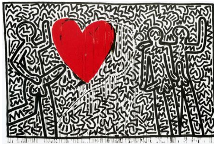
Obra de Keith Haring (Sin Título, 1982)