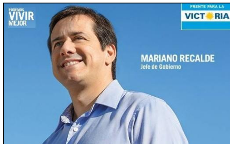
Imagen 3: Afiche del FPV para la campaña electoral del año 2015