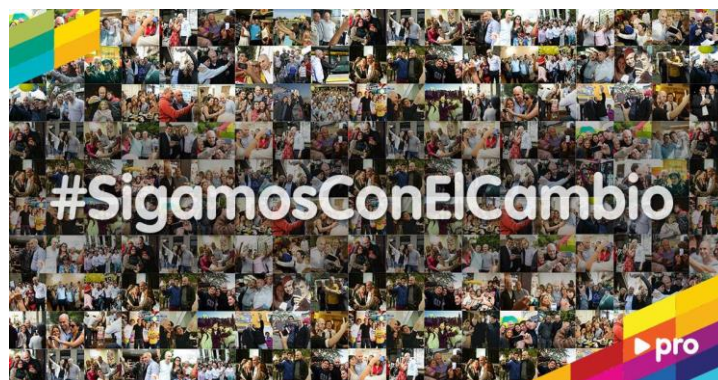
Imagen 1: Afiche del PRO para la campaña electoral del año 2015