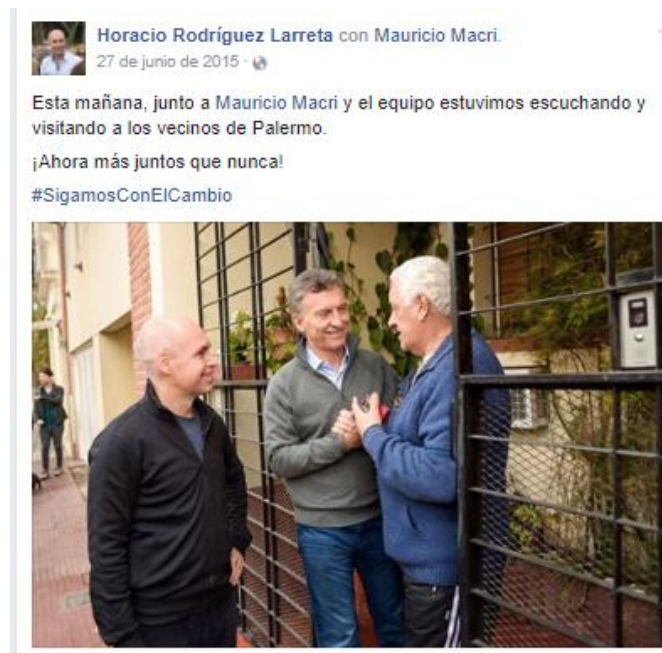
Imagen 4: Presencia de Horacio Rodríguez Larreta en timbres junto a Mauricio Macri

En el caso de Mariano Recalde y Gabriela Cerruti del FPV este tipo de presencias en el territorio se daban en plazas y parques de la ciudad, había un grupo de vecinos que escuchaban al candidato y se observaba una fuerte presencia de militantes.