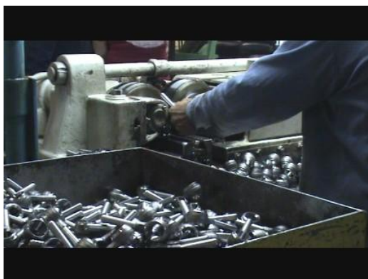
Figura 2. Rotulación de piezas

C. me mostró unos rodillos con los cuales hacen las rótulas, son rodillos que están muy gastados, me explicó. Me dijo que la muy buena calidad que tienen las piezas que ellos hacen es gracias a la experiencia que tienen los trabajadores de la cooperativa, ya que las máquinas son muy viejas. El laminado de piezas, en cualquier otra fábrica de autopartes se hace de forma automática, en cambio con la máquina que tienen ellos se hace de forma manual.