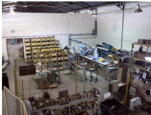
Figura 1. Vista desde la ventana de la oficina de administración. Se puede ver el sector de armado de la planta.

trabajar mejor u otros tipos de sillas e incluso disponer los materiales de forma diferente para no tener que desplazarse tanto por la planta. En cuanto a estos aspectos, llama la atención incluso cierta separación entre el espacio físico en el cual se encuentran las oficinas de la Comisión Directiva que se ocupa a su vez de los aspectos administrativos y el resto de los trabajadores que están en el sector de mecanizado y armado. Las oficinas administrativas se encuentran “arriba” (son identificadas de esta manera por los trabajadores), es decir, en un primer piso de la planta, y los sectores de armado y mecanizado “abajo” (en planta baja). Incluso hay una ventana desde la cual los miembros de Comisión Directiva pueden ver lo que sucede “abajo” tal como si fuese un panóptico.