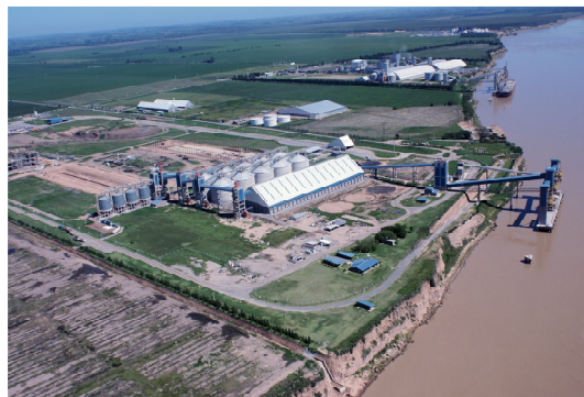
FIGURA 4: Fotografía tomada en febrero de 2009

El Jefe Comunal de la localidad explica las transformaciones de los últimos años de la siguiente manera: