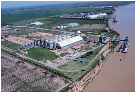
Fotografía aérea de la costa de la localidad tomada en febrero de 2009.

En este contexto, la investigación se propuso como objetivo principal generar conocimiento sobre la diversidad de sentidos en torno a la tecnología en cuatro espacios analíticos diferentes de esta localidad: las empresas recientemente instaladas, el Gobierno local, los ámbitos educativos de la localidad y trabajadores que ejercen o ejercieron oficios tradicionales (por ejemplo, carpintería, herrería, costura, entre otros).