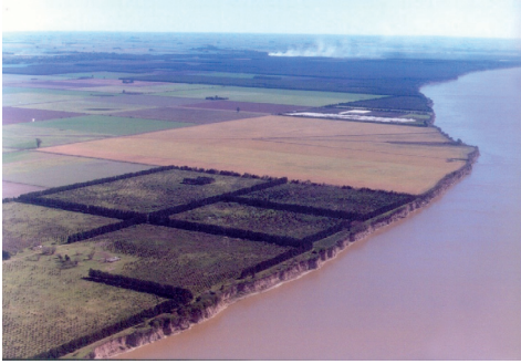
Fotografía aérea de la costa de la localidad tomada en diciembre de 2006, previamente a la construcción de las plantas.