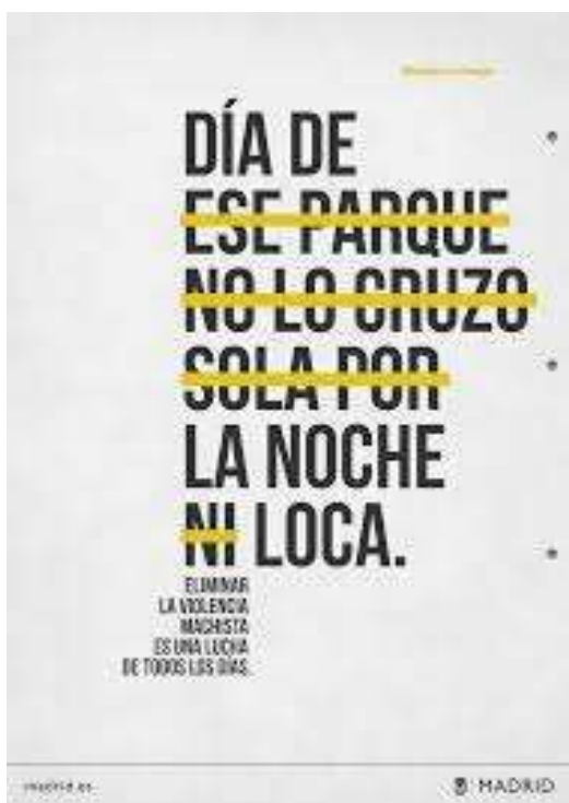
Figura 3. Campaña del Ayuntamiento de Madrid contra el machismo en adolescentes diseñada para el curso 2016-2017.

Así, si analizamos las últimas campañas publicitarias para prevenir la violencia y el machismo entre adolescentes (ver Figura 3) realizadas por el Ayuntamiento de Madrid, se puede constatar que emplean estas Perspectivas Críticas Radicales reproduciendo imágenes y modelos que se presentan como alternativas posibles, orgullosas, libres y descaradas de lo que quieren erradicar.