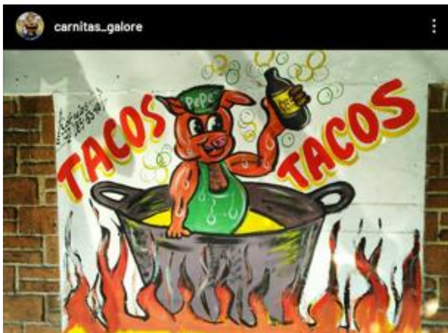
Figura 5. Carnitas Galore [@carnitas_galore]. (30 de septiembre de 2020). Salud chavos [fotografía]. Instagram. https://www.instagram.com/p/CFxF7uqFSr3/