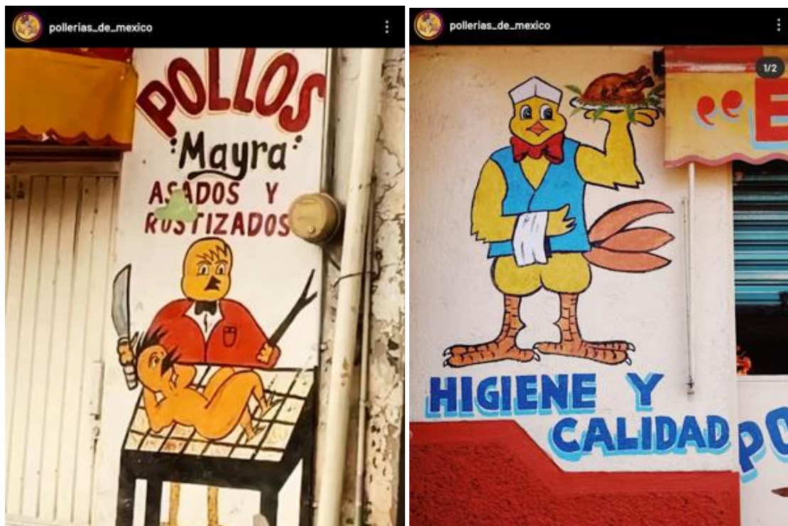
Figura 6 y Figura 7.